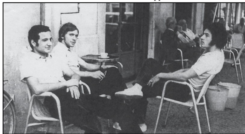
Tre amici al bar.

Il Bar si trovava nell'edificio adiacente alla gelateria, dove dal balcone parlò alla popolazione Giuseppe Garibaldi.