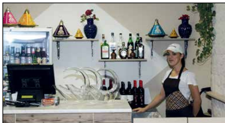
BAR: BIBITE E LIQUORI DELLE MIGLIORI MARCHE - VINO D.O.C.

APERTO da Lunedì a Domenica SOLO SERA 18,30 - 24,00 chiusura cucina ore 23