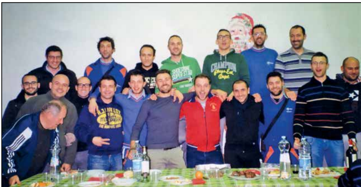
La tradizionale foto ricordo di fine anno all'Enel.

Volti sorridenti con la gran voglia di vivere, lavoratori consapevoli di rendere un servizio importante alla cittadinanza.