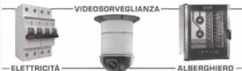
ELETTICITA' VIDEOSORVEGLIANZA ALBERGHIERO

MONTICHIARI BS Via A. Mazzoldi, 15 Cell. 328 3622089 - info@montiservice.com www.montiservice.com