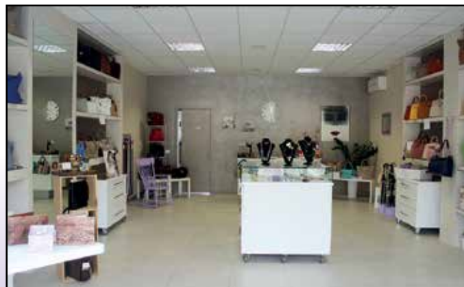
Il negozio di Madame Coco a Montichiari dopo la Farmacia Comunale.